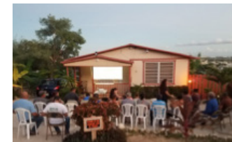
Charla sobre el mosquito en la Comunidad El Sol