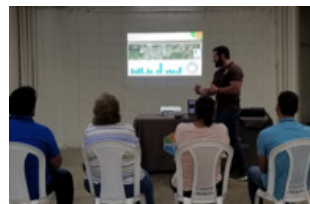
Reunión comunitaria en Constanza hablando sobre la cantidad de mosquitos en la comunidad