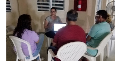
Reunión comunitaria en Madrigal hablando sobre el proyecto COPA.