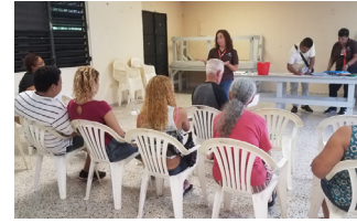
Centro Comunal Brisas del Caribe Convocatoria a Elección de la Junta Comunitaria.