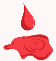
Sangrado (nariz, encías, vómitos, heces, orina o aumento en sangrado si es fémina en menstruación o sangra sin estar en menstruación)