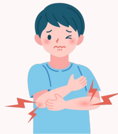
Dolor en músculos, articulaciones y huesos